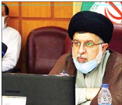
شیراز-چراغی-خبرنگارمملکت-رئیس کل دادگستری استان فارس از کشف سه محموله مواد مخدر در

گرگان-میلاذ-زورایی-خبرنگارمملکت- شهردار گرگان در خصوص پروژه تله کابین توضیحاتی ارائه کرد دکتر دادبود گفت: ساخت تله کابین گرگان با رعایت ملاحظات دستگاه های متولی به زودی آغاز می شود شهردار گرگان از آغاز ساخت پروژه تله کابین این شهر با رعایت تمامی ملاحظات و نظارت دستگاه های متولی در آینده ای نزدیک خبر داد.