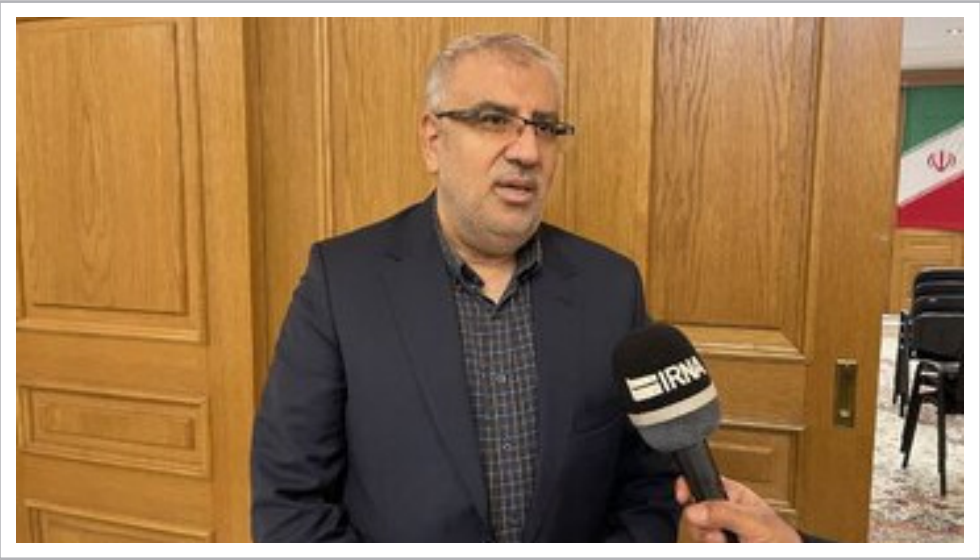
وزیر نفت در جریان بازدید از شرکت پارس پتروپال