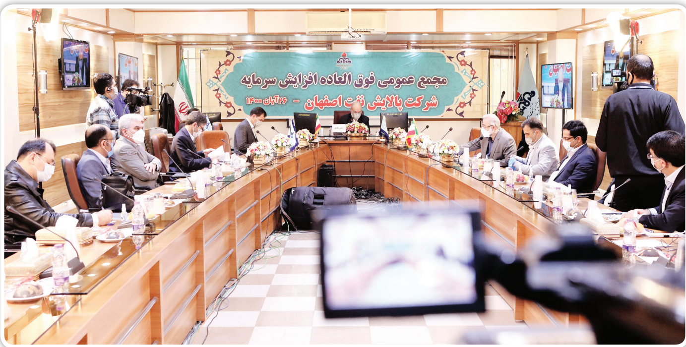
با تصویب در مجمع عمومی فوق العاده شرکت پالایش نفت اصفهان، سرمایه این شرکت از ۷۶ هزار میلیارد ریال به حدود ۱۳۹ هزار میلیارد ریال رسید.