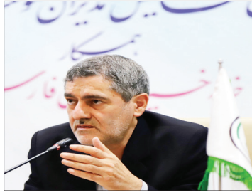
شیراز-چراغی،خبرنگارمملکت-دکترمحمدهادی ایمانیه در نشست هم اندیشی خانه خیرین اظهار داشته بسیجی کسی است که رفاه خود و خانواده خود را برای آسایش و رفاه دیگران فدا می کند و خیرین از این جمله هستند.

نماینده عالی دولت در استان فارس تاکید کرد: دستگاه های مسوول باید موضوع سازمان دهنی موسسات و سمن های فعال در حوزه های حمایتی را با جدیت پیگیری کنند تا خدمت رسانی به محرومین و نیازمند به شکل مطلوب و عادلانه صورت گیرد.وی با بیان اینکه یک نفر به انتخاب خود موسسات، رابط خیریه ها با استاندار فارس تعیین خواهد شد،ادامه داد: کار خیریه ها یک روز هم نباید معطل شود.مدیریت ارشد استان در دوره فعلی، وقت ویژه ای برای خیرین اختصاصی می دهد.استاندار فارس با اشاره به اینکه وقف سنت حسنه ای در تاریخ اسلام است که از گذشته رواج و رونق داشته است،افزود: باید برای رونق هرچه بیشتر این سنت حسنه تلاش بیشتری صورت گیرد زیرا تا زمانی که بشر وجود دارد، مزایای وقف مورد استفاده قرار می گیرد.دکتر ایمانیه اظهارداشت: باید آماری از تبدیل مددجو به مددکار تهیه شود تا رقابت مثبتی بین موسسات خیریه برای تبدیل مددجو به مددکار ایجاد شود. نماینده عالی دولت در استان فارس تصریح کرد: برای ساخت دفتر محل استقرار موسسات خیریه، استانداری آمادگی دارد با تامین زمین و صدور مجوزهای لازم از این اقدام حمایت کند.وی با تاکید بر اینکه اداره کل بازرسی استانداری فارس به موضوع کاستی و اختلال در رسیدگی به درخواست های خیریه ها رسیدگی می کند،گفته: نباید شاهد کم کاری کارکنان دولت در پاسخگویی به خیریه ها باشیم و همه ما به عنوان کارکنان دولت موظف به پاسخگویی مطلوب و پیگیری مسائل و درخواست های خیرین بزرگوار هستیم.