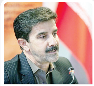
رئیس جهاد کشاورزی استان خبرداد

کار جامعه به کیفیت خدمت رسانی این شرکت بستگی دارد پیر پیران ابراز داشت: ایجاد برق پایدار و مطمئن یک هنر و وظیفه است که با برنامه ریزی های مدون می توانیم در کنار شرایط ایجاد آن به گستردگی شبکه های برق و همچنین کاهش تلفات و حفاظت از شبکه نیز بپردازیم وی با اشاره به حساسیت و استراتژیک بودن شبکه های توزیع برق گفت : شبکه هوشمند بود در جهت رفع مشکلات شبکه و مدیریت بهتر و کارآمدتر سیستم قدرت امکان پایش کامل و کنترل لحظه به لحظه تجهیزات را