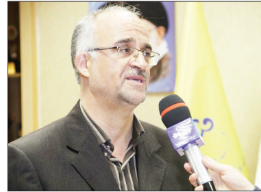
مدیرعامل شرکت گاز استان

کاهش دما، شاهد افزایش مصرف گاز در بخش مشترکین خانگی هستیم، بطوری که هم اکنون شاهد افزایش ۲۰ درصدی مصرف گاز نسبت به مدت مشابه سال گذشته هستیم، وی، با اشاره به اینکه بیش از یک میلیون و ۷۰۰ مشترک گاز طبیعی در سطح استان وجود دارد که از این تعداد بیش از ۲۷۸ هزار مشترک روستایی و یک میلیون ۶۹۲هزار مشترک شهری هستند، اظهار کرد:با توجه به اینکه اکنون در فصل سرما هستیم می طلبیم مصرف بهینه گاز را در دستور کار قرار دهیم. مهندس علوی، تاکید کرد:از مردم و مشترکین می‌خواهیم که