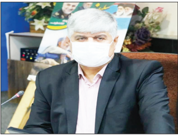
معاون آموزش و پرورش مازندران تأکید کرد