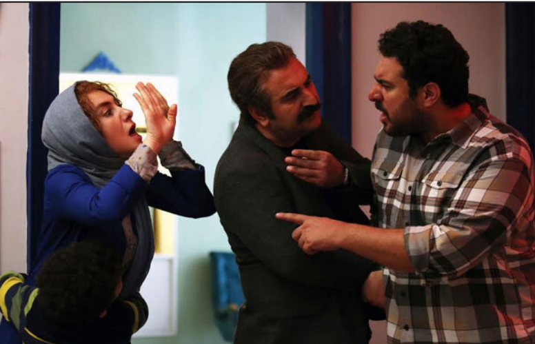
حلزون» تعلق بگیرد اما هنوز جوابی به این درخواست داده نشده است.

می‌دهند به سالن‌های کنسرت، سالن‌های نمایشی و حتی رستوران‌ها با چندین برابر قیمت بروند حتی احساس می‌کنم عدم استقبال از سینما باعث شده است فیلم ما هم تا به امروز فروش متوسطی داشته باشد. حمایت نکردن از کارگزاران دولتی، قیمت بالای بلیت، رشد بی‌رویه پلتفرم‌ها، این تصور ذهنی که هر فیلم پس از پایان بلافاصله با کمترین هزینه در اختیار مخاطبان قرار خواهد گرفت و امثال این