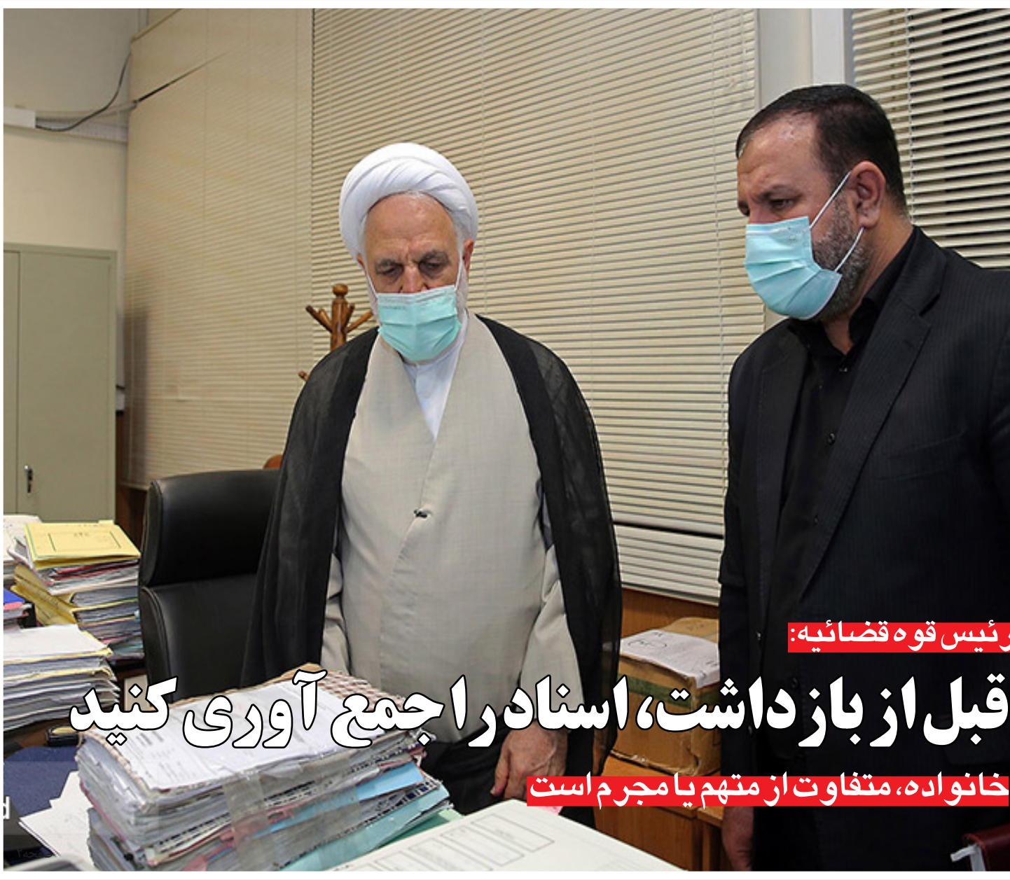
رئیس قوه قضائیه:

معاون صنایع عمومی وزارت صنعت و تجارت گفت: حجم کالای قاچاق لوازم خانگی سالیانه یک میلیارد و ۷۰۰ است... میلیون دلار و حجم کالای غیر قاچاق در این بخش چهار میلیارد و ۳۰۰ میلیون دلار است... صفحه ۶