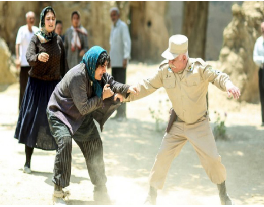
میرشکاری، طراح صحنه: امیرحسین قدسی، طراح لباس: مارال جیرانی، جلوه‌های ویژه بصری: جواد مطوری، مدیر برنامه‌ریزی: مازندران اسماعیلی، منشی صحنه: محسن بهاری، عکاس: نوشین جعفری، جلوه‌های ویژه میدانی: آرش آقابیک، مجری طرح و مدیر تولید: مهدی بدرلو و تهیه کننده: جواد نوروزیگی.

فیلم سینمایی «بی همه چیز» از روز پنجشنبه در سینماهای اقلیم کردستان عراق اکران می‌شود.