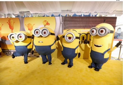
لاندگرن» و «دن ترخو» صدای پیشگان انیمیشن جدید «مینون‌ها» ظهور گروه هستند.

به کار خود پایان داد. «من نفرت انگیز ۲» در سال ۲۰۱۳ با فروش آغازین ۸۴ میلیون دلار اکران شد و ۹۷۰ میلیون دلار در سرتاسر جهان به دست آورد، در حالی که «من نفرت انگیز ۳» با شروع ۷۲.۴ میلیون دلاری در سال ۲۰۱۷ با فروش یک میلیارد دلار رسید. با این حال پر فروش‌ترین فیلم این مجموعه تاکنون به دنباله مستقل «مینون‌ها» تعلق دارد که در سال ۲۰۱۵ ۲۰۹ میلیون دلار در سرتاسر جهان دست یافت و هم‌اکنون در تبه ۲۲، پر فروش‌ترین فیلم‌های تاریخ سینما قرار دارد. قسمت جدید «مینون‌ها» در مقایسه با فروش پیش‌نمایش آثار رقیب چون انیمیشن «لایتنر» (۵.۲ میلیون دلار) و «سونیک خارپشت ۳» (۶.۳ میلیون دلار)، عملکرد بهتری داشته و این نشانه مثبتی برای اقبال خانواده‌ها به قسمت جدید این انیمیشن در سالن‌های سینما خواهد بود. «ژان -کلود دام»، «راسل برنند»، «جولی اندروز» و «الن آر کین»، «تراجی هنسون»، «میشل یئو»، «لوسی لاولس»، «دولف