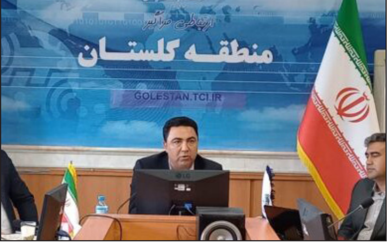
شهرمدی با اشاره به اینکه مجهز شدن به فناوری ها و تجهیزات بروز می تواند عامل مهمی در ایجاد زیرساخت های ماندگار باشد افزود: توسعه و تامین