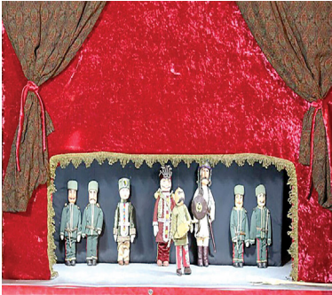
حادث کریمیان، مدیر هنری: دارپوش آهنجیان، طراح صحنه: نگین کریمی نظر، طراح لباس: شیدا حشمتی، عکاس پشت صحنه: آیدان پانلو، منشی صحنه: ساریناسلطان، طراحی پوستر: نیلوفر نوایی، و اصلاح رنگ: امیرحسین تحسینی، استودیو rush and cut، مدیر تولید: میلاد اسدزاده، صدابردار: جابر انصاریان، دستیار دوم کارگردان: روابط عمومی: مریم قربانی‌نیا.

بازی محلی در منطقه بیابانی شده که در نهایت با استخوان‌های جسدی در زیر خاک مواجه می‌شوند. از طرفی کودکی در گروه مشغول بازی کامپیوتری است که در نهایت و در ادامه بازی گروهی را هدف شلیک قرار می‌دهد که همان گروه کودکان است. حمید میربد، مجید عسگری، نیم‌مجرد یوسفی، سامیار محمدی، یزدان کوکی صبا، پارسا طلائی، فرید فرجی، بارمان بویرد، یاز بیکران این فیلم کوتاه هستند. عوامل این فیلم کوتاه نیز عبارت‌اند از: نویسندگان و کارگردان: آسیه اسدزاده، تهیه‌کنندگان: شهرام اسدزاده و مهدی مقصود، مجری طرح: موسسه نقطه عطف سینما تئاتر و کمپانی سینمایی seen، مدیر فیلمبرداری: امیر معقولی، دستیار اول کارگردان و برنامه‌ریز: عارف ابراهیمی، تدوین: صداگذاری و اصلاح رنگ: امیرحسین تحسینی، استودیو rush and cut، مدیر تولید: میلاد اسدزاده، صدابردار: جابر انصاریان، دستیار دوم کارگردان: روابط عمومی: مریم قربانی‌نیا.