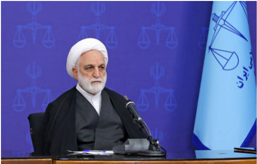
رئیس قوه قضائیه در جریان دیدار با روحانی

رئیس قوه قضائیه تأکید کرد: حضور مقامات قضایی در مساجد و ملاقات بی واسطه با مردم و شنیدن مشکلاتشان مسائل مطرح شده تبدیل به رویه شود و بعد از ماه رمضان هم ادامه داشته باشد.