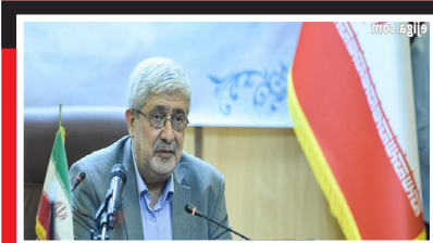
معاون قضایی دادستان کل کشور تشریح کرد: