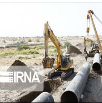
نفر جمعیت استان اردبیل، ۴۴۸ هزار و ۵۵۴ نفر در یک هزار و ۵۵۵ روستا سکونت دارند که از این تعداد یک هزار و ۲۴ روستا بالای ۲۰ خانوار هستند.

مدیرعامل شرکت گاز استان اردبیل با اشاره به دشواری شبکه‌گذاری گاز طبیعی در مناطق صعب‌العبور افزود: کار در مناطق جنوبی استان به واسطه کوهستانی بودن و پراکندگی روستاها با دشواری‌هایی همراه است که هزینه و زمان اجرای طرح‌ها را تحت تاثیر قرار می‌دهد؛ به طوری که در برخی نقاط به منظور جابه‌جایی لوله‌های گاز از چهارپایان نیز کمک گرفته شد اما با همه این مسائل شبکه‌گذاری کاملاً با همت و جدیت مسئولان و پیمانکاران به سرعت در حال انجام است و در آینده نزدیک شاهد گازرسانی به ۱۱۰ روستای دیگر خواهیم بود.