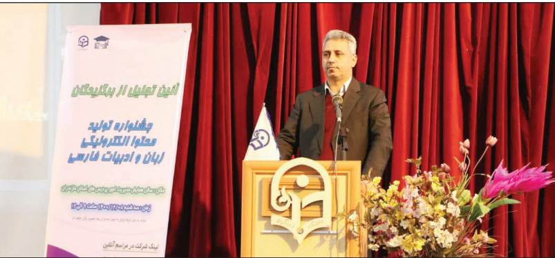
معاون آموزش متوسطه استان با بیان اینکه در راستای کیفیت بخشی به امر یادگیری و ایجاد فرصت‌های برابر خاطر نشان کرد: در این خصوص استراتژی را طراحی کردیم که در آن به بررسی عوامل افزایش تقویت

وی با تأکید بر اهمیت و حساس بودن امر آموزش و تدریس در عصر کرونا افزود: هر کسی که سواد و معلوماتی در رشته خاص کسب کرده است لزوماً نمی‌تواند معلم موفقی محسوب شود و موفق بودن نیازمند به کسب مهارت حرفه‌ای است.