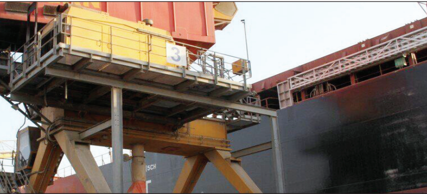
جو، یک میلیون و ۸۵۲ هزار تن دانه روغنی، ۲ میلیون و ۶۲۶ هزار تن کنجاله

سویا، ۵۴۱ هزار تن شکر خام، ۳۷ هزار تن برنج و ۶۸۳ هزار تن روغن بوده که به سراسر کشور منتقل گردید.