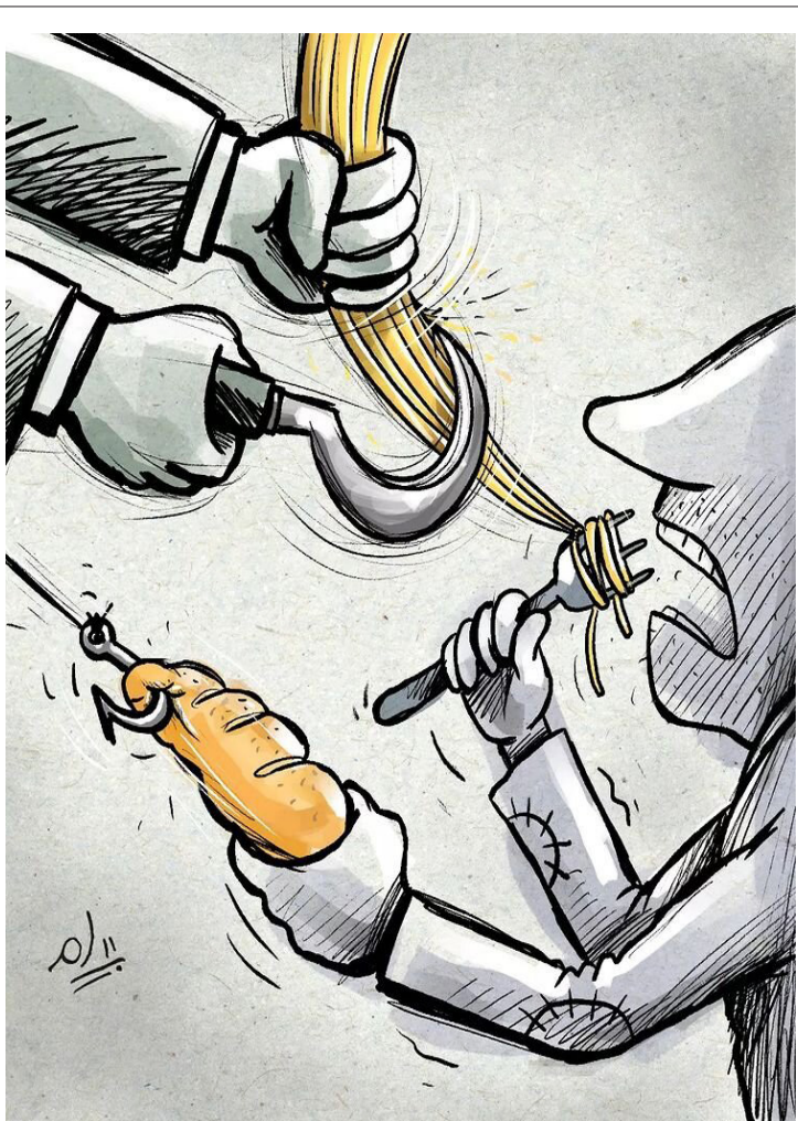
بینید چه بر سر خورد و خوراک مردم آمده!