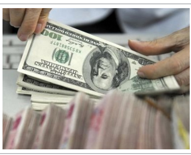
دستفروشی دلار در تهران