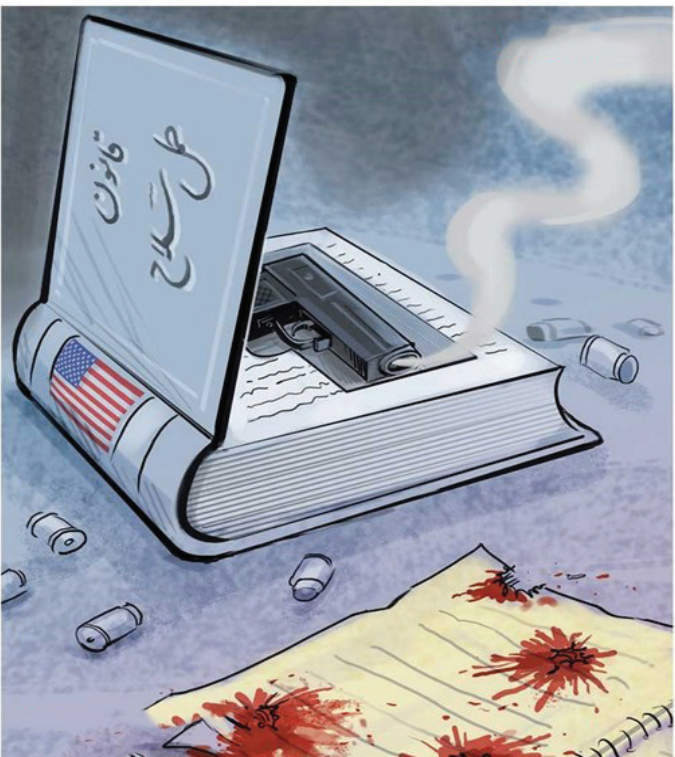
کشتار جنون آمیز کودکان دبستانی در آمریکا