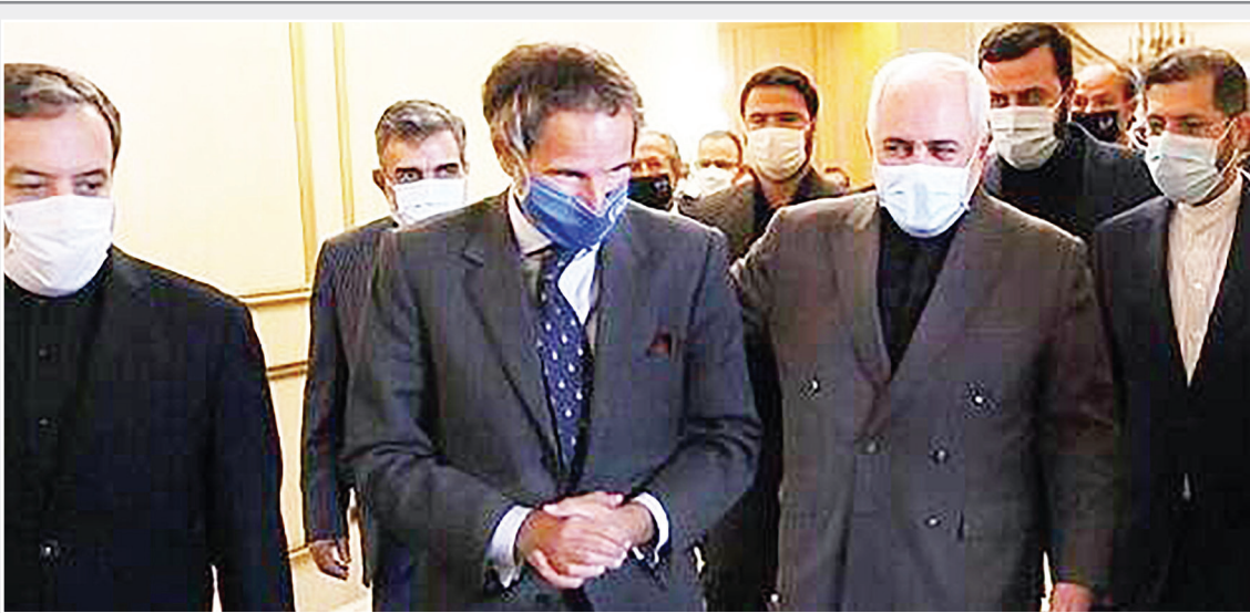
گام تهران و واشنگتن در مسیر دیپلماسی

وی ادامه داد: ترامپ با گفتار و رفتارش حیثیت آمریکا را برد و حتی قوانین کشورش را زیر پا گذاشت و نشان داد که آنها، به هیچ چیز پایبند نیستند اما امریکا رو به افول و سقوط است و ما رو به صعود هستیم و آینده از آن ماست. قدرت ما ناشی از قدرت خداست و ضعف آمریکا بیش از حد تصور ماست. امروز آنها به جان هم افتاده‌اند. رئیس مجلس خبرگان رهبری در بخش دیگری از سخنانش با تقدیر مشاکرت مردم در انتخابات مجلس شورای اسلامی گفت: مردم در انتخابات مجلس با مشارکت