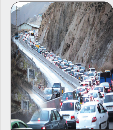
لرزم اعتماد سازی در جامعه تاکید کرد و ادامه داد: در سیل دی مساه پل توکل آباد در ریگان در حال فروریختن بود اما هر چه ما به مردم می‌گفتیم که پل در حال ریزش است، توجیهی به خطراتهای ما نمی‌کردند تا با ورود شورای تأمین و نیروی انتظامی توانستیم جلوی تردد از روی این پل را بگیریم و کمتر از پنج دقیقه بعد پل ریزش کرد و این مهم نشان دهنده عدم اعتماد مردم است. مدیرکل راهداری و حمل و نقل جاده‌ای استان کرمان درباره پیش‌فروش بلیط‌ها سخن به میان آورد و تصریح کرد: پیش‌فروش بلیط از دهم اسفند به صورت اینترنتی آغاز شده و ۵۰ درصد ظرفیت به این صورت به فروش می‌رسد و مابقی ظرفیت به صورت حضوری فروخته می‌شود.