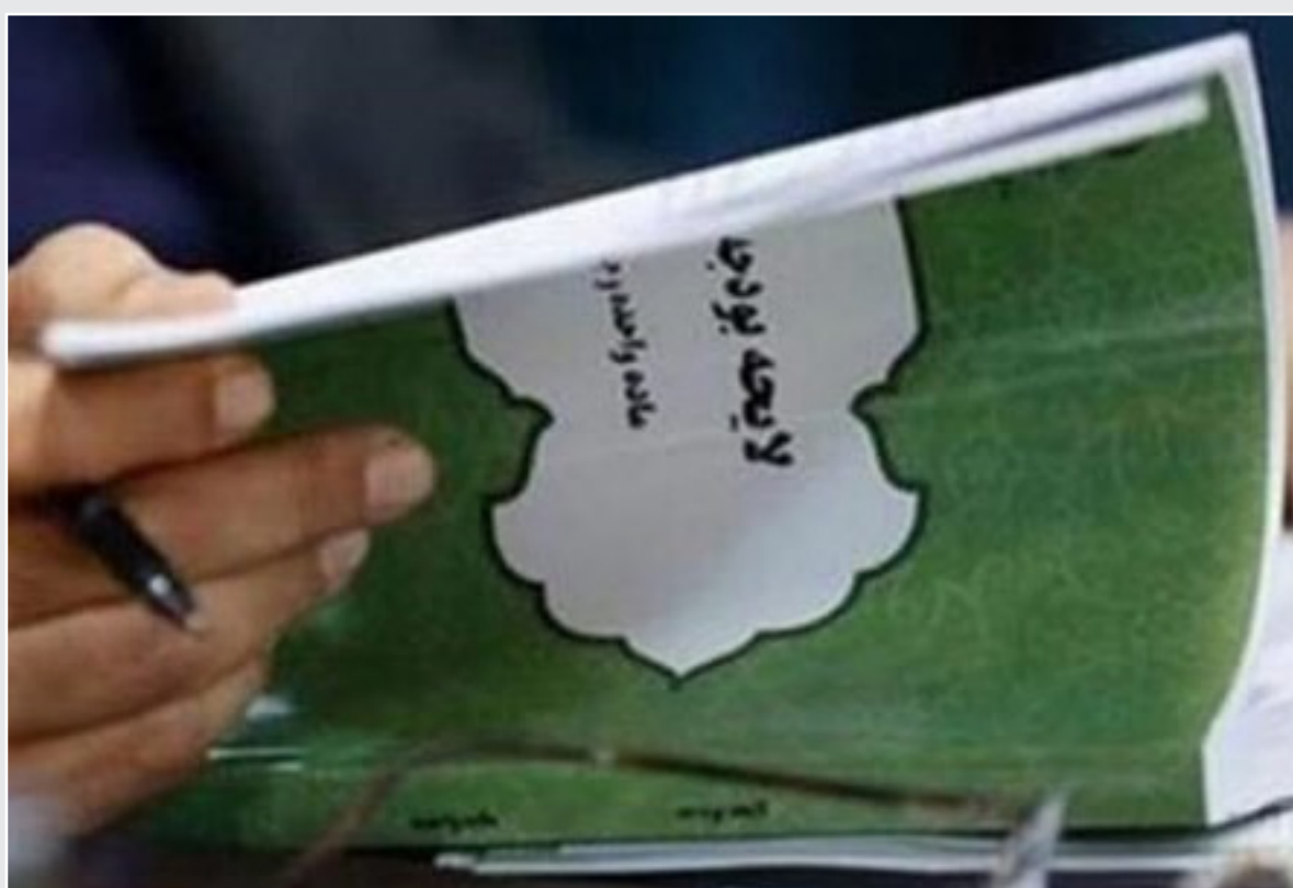
بودجه ۱۴۰۱ با طرح‌های توری می بسته شده است