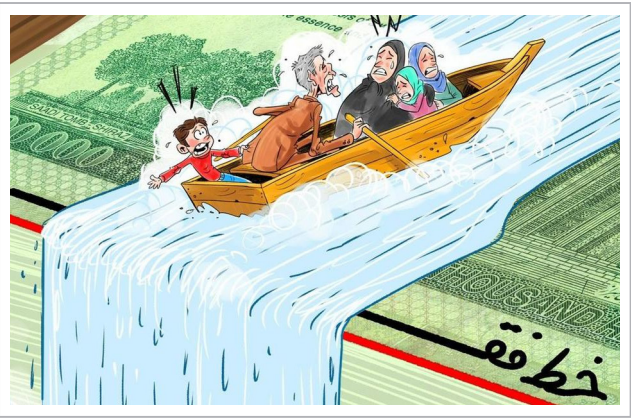
خط فقر در کشور ما

سید ابراهیم رئیسی، در جدیدترین برنامه‌ها و اقدامات خود برای حل مشکلات کشور، دستور داد که «نسبت به ریشه‌کن کردن فقر مطلق از تمام ظرفیت‌ها استفاده و اجازه ندهید این موضوع به سال ۱۴۰۱ برسد.» سیدابراهیم رئیسی روز ۱۴ اسفند در مراسم واگذاری ۸۷۰۰ واحد مسکونی به مددجویان و بهره‌برداری از پنل‌های خورشیدی روستای ملاعلی کردستان، گفت: «جدای از نهادهای انقلابی، خیریه‌های دیگری هم در مسیر ریشه‌کن کردن فقر در کشور فعالیت دارند. جامعه اسلامی را باید بر عدل استوار ساخت، چون نظامات اجتماعی و موضوع اقتصادی باید مبتنی بر عقل بنا شود. فقر پدیده و محصول بی‌عدالتی‌های اقتصادی و محصول بی‌عدالتی‌های اجتماعی است و اگر هر چیز در جای خود قرار گیرد و توزیع ظرفیت‌ها عادلانه صورت باشد دیگر شاهد فقر نخواهیم بود.» رئیس عنوان کرد: «این که باید تصمیمات اقتصادی در کشور مبتنی بر نظام عادلانه، تولید و توزیع باشد تردیدی نیست و این کار باید حتما انجام شود. به صورت نسبی وقتی نگاه می‌کنیم می‌بینیم توزانی در توسعه وجود ندارد لذا باید اجرائی عدالت در عمل نسبت به حوزه‌های مختلف اتفاق بیفتند این‌ها همه کارهای زیرساختی و زیربنایی است که بتوانیم در جهت رفیع فقر و محرومیت تاثیرگذار باشیم.»