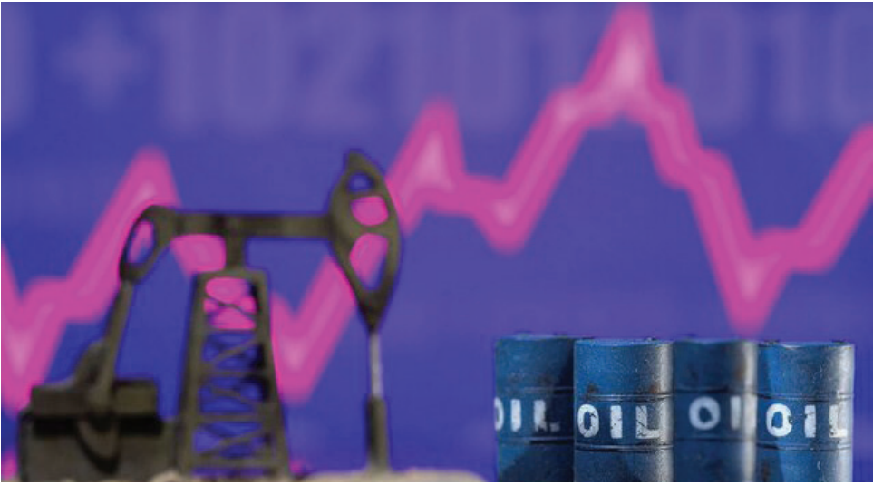
علیه واردات نفت روسیه پیدا کرده بود. بر اساس گزارش روبرو، اداره اطلاعات انرژی آمریکا در گزارش رشد کرده به بالاترین میزان از نوامبر رسید.