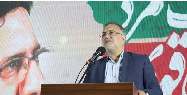
آیتنا خواهد کرد.

شهردار تهران اضافه کرد: شرایط امروز به ویژه برای طبقات متوسط و کم‌درآمد جامعه و مناطقی مانند ۱۷ بخش تالاش و کوشدشی که آقای رئیسی انجام می‌دهند حتماً آینده بسیار خوبی در برابر ما وجود دارد.