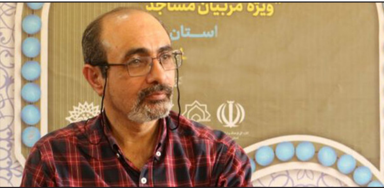
ویژه مربیان مساجد استان

حوزه های فرهنگی، نمایش، خط و... فعالیت کند و در گام دوم این طراحی مقرر شده بود که کودک در این محیط هارشد و در دوران نوجوانی در خانه های نوجوان استعداد خود را بروز دهد اما ما در این طراحی به دلیل عدم فراگیری موفق نبودیم. این مدرس تئاتر با تصریح بر این نکته که در