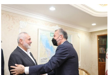
سوی رژیم کودک‌کش صهیونیستی، تحت حمایت غرب، جنایات وحشیانه اشغالگران صهیونیست علیه قدس، مسجداقلصی، غزه و سرزمین‌های اشغالی فلسطین،

تجاوزات و جنایات رژیم اشغالگر علیه ملت و مقدسات فلسطین را محکوم کرد و مراتب پشتیبانی جمهوری اسلامی ایران در دفاع مشروع مردم و مقاومت فلسطین در برابر اشغالگری رژیم صهیونیستی را مورد تأکید قرار داد. اسماعیل هنیه رئیس دفتر سیاسی جنبش مقاومت اسلامی حماس نیز در این دیدار با قدرتی از حمایت و پشتیبانی جمهوری اسلامی ایران از مبارزه مردم فلسطین در مسیر مبارزه با تجاوزات مستعمر رژیم صهیونیستی، خواستار تحرک و بسیج مواضع اسلامی و عربی و بین‌المللی به منظور اتخاذ مواضعی قاطع علیه سرکشی‌های این رژیم شد.