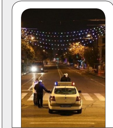
پلیس راهور ناجا اعلام کرد: مردم نگران پیامک‌های جریمه در روزهای ۲۷ و ۲۸ خرداد نباشند

وی خاطرنشان کرد: با استناد به مجوز وزارت بهداشت که واکسن به صورت