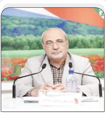
عملیات بازسازی شبکه فاضلاب را سرعت دهیم.

شاهین شهر را از لولویت آبفای استان اصفهان دانست و گفت: عملیات بازسازی این کلکتوربا قطر ۱۲۰۰ و ۱۶۰۰ میلیمتر در عمق ۸ تا ۱۲ متری زمین و عرض چهار متر به دلیل عبور و مرور زیاد در این محدوده کار بسیار سختی است، وی افزود: بر همین اساس درصدد هستیم تا با بهره گیری از روش های نوین از جمله استفاده از دستگاه حفار TBM و عبور لوله از تونل های حفر شده به جای روش های سنتی، مشکل ریزش دیواره تونل ها و فرونشست زمین را حل کرده و