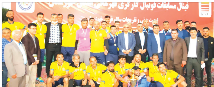
فولاد خوزستان، دبیر اجرایی خانه کارگر استان، پیشکسوتان و علاقمندان به ورزش در زمین شماره یک مجموعه فولاد خوزستان بود.

به گزارش روابط عمومی شرکت سیمان خوزستان، عصر امروز سه شنبه پنجم بهمن ماه سال جاری؛ ماراتن مسابقات فوتبال قهرمانی کارگران خوزستان به خط پایان رسید که در دیدار پایانی دو تیم قدرتمند سیمان و فولاد خوزستان به مصاف هم رفتند که این بازی در پایان وقت های قانونی برنده ای نداشت و با نتیجه یک بر یک به پایان رسید و بازی به ضیافت پنتالی کشیده شد که در ضربات پنالتی این تیم سیمان خوزستان بود که در نهایت با نتیجه ۴ بر ۱ تیم خوب و یگ دست فولاد خوزستان را از پیش روی برداشت و جام قهرمانی را بالای سر برد.