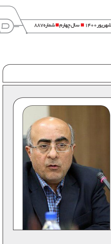
روزنامه صبح ایران

او نتیجه گرفت: به این ترتیب نمی‌توانیم تنها با مقایسه نرخ تورم داخلی و نرخ تورم خارجی قیمت ارز را مشخص کرد.وی گفت: حتی در حوزه نرخ تورم نیز باید مسائل داخلی را بررسی کرد به عنوان مثال مسکن به عنوان یکی از عوامل موثر در نرخ تورم محسوب می‌شود اما مسکن قابل معامله بین المللی نیست. در عین حال برخی تنها