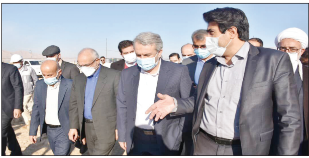
پترو پیمان دانا و شرکت طالب صنعت سپاهان در شهرک صنعتی مهر بازدید شد.

جنوب و سایر صنایع مستقر و در حال احداث در منطقه ویژه اقتصادی لامرد احداث خواهد شد. این نیروگاه با استفاده از توربین های کلاس F، ضمن آلایندگی کمتر در تولید انرژی الکتریکی در مصرف سوخت نیز صرفه جویی خواهد داشت و اشتغال ۱۵۰ نفری به صورت مستقیم و ۳۰۰ نفری به صورت غیر مستقیم را به دنبال خواهد داشت.