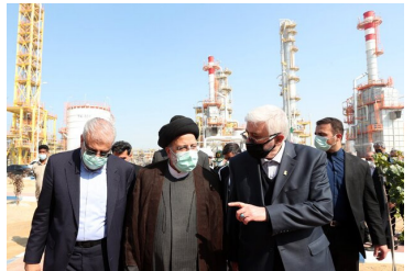
در گفت‌وگو با خبرنگاران در پاسخ به این سوال که افتتاح این طرح چه تأثیری در جلوگیری از

رئیس جمهور گفت: بانک‌های کشور در این طرح مهم سرمایه‌گذاری کرده‌اند که هم خودشان سود می‌برند و هم محصول برای مردم خواهد بود.