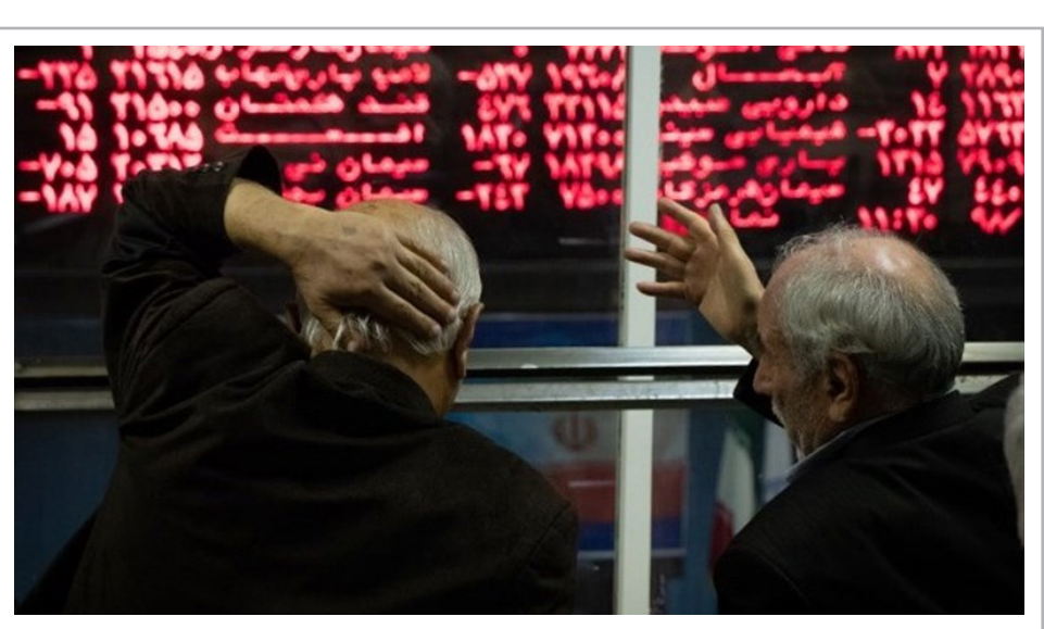
واحد قرار گرفت.

در این بازار هم امروز سهامداران شرکت‌های شیر پاستوریزه پگاه گلستان، ویتانا و سرمایه‌گذاری مسکن زاینده رود امروز