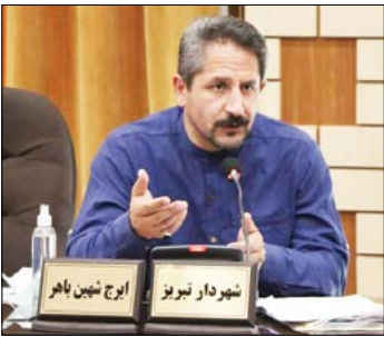
تبریز- خبرنگارمملکت - شهردار تبریز گفت: بر اساس اعلام کمیسیون ملی ایران - یونسکو، پرونده تبریز در حوزه شهر خلاق ادبیات به یونسکو ارسال شد.

تبریز ششمین باهر با اعلام این خبر اظهار کرد: تبریز، خاستگاه مکاتب برجسته هنری و ادبی است و شعر و ادب و هنر آذربایجانی در طول تاریخ توسعه یافته به نحوی که این شهر در هزار سال گذشته محل نشست و برخاست فضلاء شعرا و ادبای بسیاری از جمله صاحب تبری، شمس تبریزی، ملا محمد فضولی، محمد حسین شهریار، پروین اعتصامی و همام تبریزی بوده است. وی ادامه داد: این موارد ظرفیت بسیار ارزشمند و گسترده ای را برای تعاملات جهانی و کسب عنوان شهر خلاق در حوزه ادبیات فراهم می سازد که برای تحقق این مهم اقدامات لازم را از ماهها قبل آغاز کردیم. وی یادآور شد: پیش از این با پیگیری های انجام یافته شهرداری تبریز لایحه ای در زمینه پیوستن تبریز به شبکه شهرهای جهانی خلاق قرار گرفت و به دنبال آن کارشناسان یونسکو در تهران مورد تصویب کمیسیون فرهنگی و شورای اسلامی شهر قرار گرفت و به عنوان آن کارشناسان یونسکو در تهران در شهرداری تبریز حضور یافتند و در خصوص تکمیل فرم های مربوط بر اساس ظرفیتهای فرهنگی و تاریخی این شهر در حوزه ادبیات اقدامات لازم و تخصصی انجام شد. شبه نقل از روابط عمومی شهرداری تبریز، ششمین باهر اپراز امیدواری کرد که با نهایی شدن انتخاب تبریز به عنوان شهر خلاق در زمینه ادبیات شاهد آثار ملموس این اتفاق خوب در حوزه های فرهنگی، گردشگری و اقتصادی باشیم.