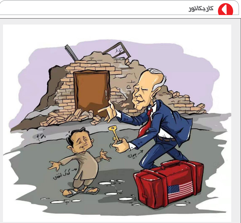
میراث بایدن برای افغانستانی‌ها! خروج ناگهانی نیروهای نظامی آمریکا از افغانستان و تحویل این کشور به طالبان بعد از ۲۰ سال که جز ویرانی و آوارگی برای مردم این کشور، چیزی نداشت، سوزه کارتون‌ی در فضای مجازی شد.