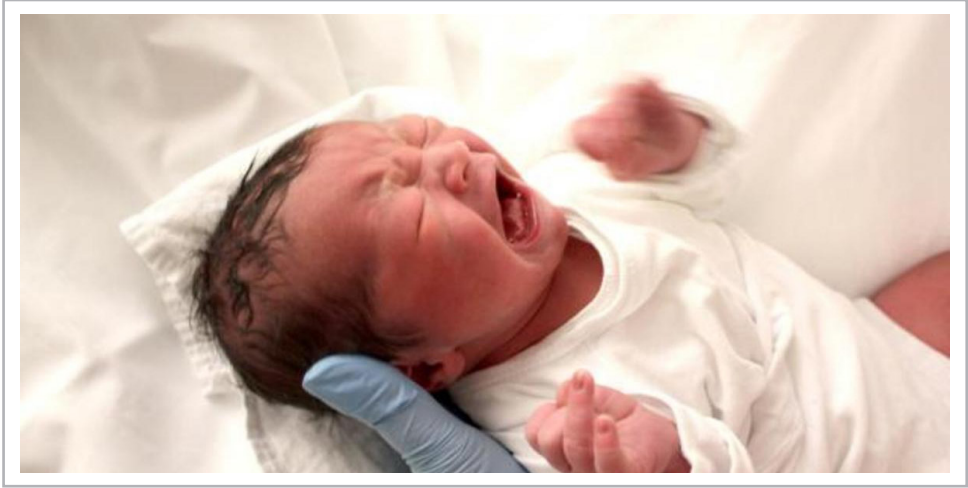
فرزندخوانده‌ای که به نام او فرزند دیگری در دنیا می‌آید

بالاقصه بچه را می‌برند که بوی مادر را نفهمد صدای قلبش را نشنود. او توضیح می‌دهد: «این اولین بار است که پرورش می‌دهند اما راه ورود مهرنوزاد به قلبشان را می‌بینند، رنج بارداری و حال وخیم زایمان را به جان می‌خرند و شهید شیرین مادری را پیشکش کسانی‌می‌کنند که از این نعمت بی‌بهراند زنانی که برای مرفه‌ترها به وقت نیازشان و در ازای مبلغی به‌عنوان یک همسر و مادر ایفا نقش کنند و بعد هم که مدت صیغه‌اشان تمام شد راهشان را می‌کشند و بی دردسر می‌روند بی زندگی‌اشان، آن‌ها بعد از وضع حمل قرار داد نوشته بین خود و جسم تحیفی که ۹ ماه سرجان کشیدند را پاره می‌کنند چراکه دردی به قوت، نداری نمی‌شناسند.