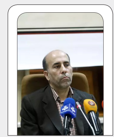
شهردار تهران در جریان دیدار با خبرنگاران.