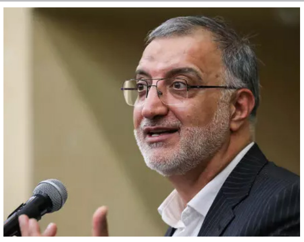
شهردار تهران گفت: ما امروز تلاش شهرداری معطوف به کمک به دیگران کرد. این راه نیاز به تکمیل دارد و حضور جدی همه مراکز که می‌توانند به ملت ما کمک کنند دارد.

شهردار تهران بیان کرد: هفته دفاع مقدس است و تجلی همان سه ویژگی که ذکر کردم باعث شد جنگ تحمیلی به دفاع مقدس تبدیل شود. وی با بیان اینکه ما راهی نداریم جز با تمسک به اسلام و پیوری در رهبری و حضور در میدان مردم توانیم از قله‌های مختلف عبور کنیم و خودمان را به قله نهایی که تحویل پرچم انقلاب اسلامی به دست ولی و صاحب حقیقی مان هست برسیم، گفت: این پاندمی روانه ده‌ها هزار نفر در سراسر جهان را داره به کام مرگ می‌کشاند. این بیماری نه چیزی است که یک روزه و یک هفته و یک ماهه پرونده اش بسته شود بلکه باید با او زندگی کنیم و مهار کنیم و زمین‌گیری کنیم. ما با همه وجود اربعین را پاس می‌داریم در این ماه‌های متمادی این کار در حال انجام است و با سربلندی از آن بیرون