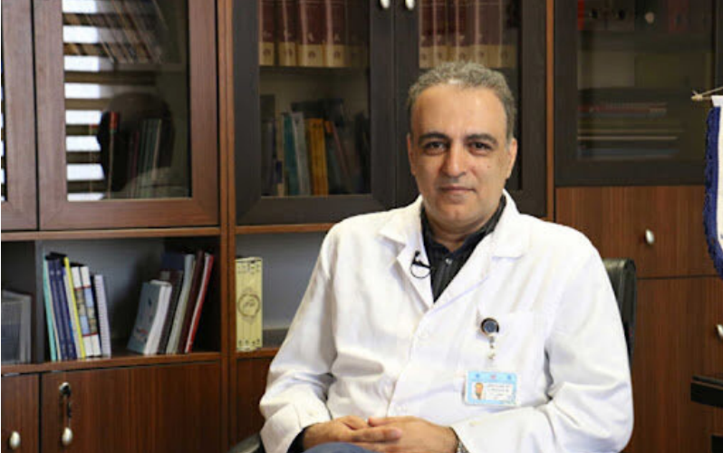
دبیر کمیته علمی ستاد ملی کرونا درباره واکسیناسیون کودکان هشدار داد.

از کشورها واکسیناسیون این گروه سنی را برای زیر ۱۲ ساله‌ها هم انجام می‌دهند. یعنی آن‌ها از ۳ سال به بالا دارند همه افراد جامعه را واکسن می‌زنند که شامل حال ۷۲ تا ۱۸ ساله‌ها هم می‌شود.»