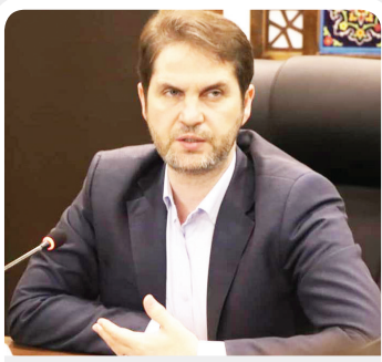
اصلی حمل کالا از استان مرکزی استاصلی حمل کالا از استان مرکزی است.

درد افزایش یافته است. وی افزود: ۱۲ درصد کالاهای حمل شده توسط ناوگان حمل و نقل جادهای استان مرکزی درون استانی و ۸۸ درصد برون استانی بوده است.