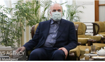
رئیس‌مجلس شورای اسلامی بر تقویت و تحکیم ارتباطات پارلمانی میان مجلس شورای اسلامی و فدراسیون روسیه تأکید کرد.

به گزارش مهر، محمد باقر قالیباف رئیس‌مجلس شورای اسلامی طی تماش تلفنی با «ویاچسلاو والودین» رئیس‌دوای دولتی فدراسیون روسیه گفتگو کرد. قالیباف در ابتدای این گفتگوی تلفنی ضمن تبریک به مناسبت انتخاب مجدد ویاجسلاو والودین به عنوان رئیس‌دوای دولتی فدراسیون روسیه بر تقویت و تحکیم ارتباطات پارلمانی میان مجلس شورای اسلامی و فدراسیون روسیه تأکید کرد.