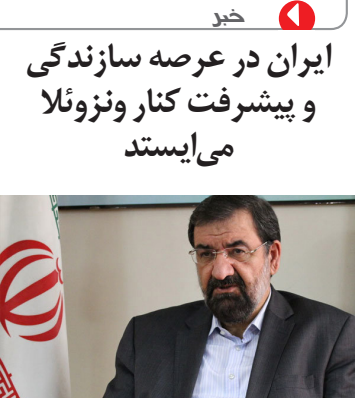
معاون اقتصادی رئیس‌جمهور گفت: ایران همانگونه که در مرحله مقاومت کنار ونزوئلا ایستاد، در عرصه سازندگی و پیشرفت اقتصاد نیز کنار این کشور می‌ایستد.

رئیس‌جمهوری اسلامی، ایران و ونزوئلا را دو کشور دوست توصیف کرد و گفت: دو کشور در مقابل نظام سلطه و کسانی که می‌خواهند به استقلال ما لطمه وارد کنند، متحد هستند. «فلیکس پالانسیا گونسالس» از ایران به عنوان کشور مهم و تأثیرگذار منطقه نام برد و گفت: جمهوری بولیواری ونزوئلا در کنار ایران به دفاع از چندجانبه‌گرایی و مقابله با مداخله آمریکا متعهد است. وزیر امور خارجه ونزوئلا هم با تأکید بر ضرورت گسترش روابط دو کشور، گفت: تدوین برنامه روابط بلندمدت دو کشور می‌تواند در تحقق این هدف مؤثر باشد و ونزوئلا آماده توسعه روابط در همه زمینه‌ها با جمهوری اسلامی ایران است.