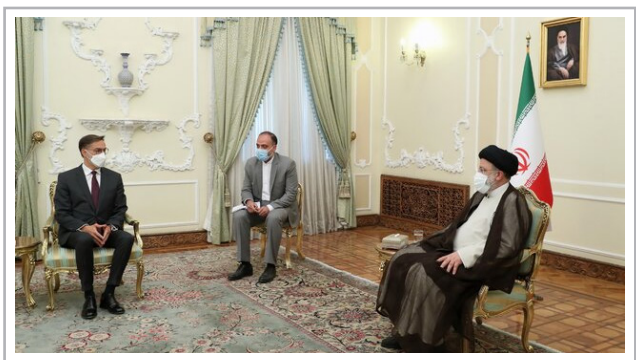
ایران، ابراز امیدواری کرد: با سفر رئیس‌جمهور ونزوئلا به تهران در آینده نزدیک، گام‌های جدیدی برای همکاری‌های

به گزارش پایگاه اطلاع‌رسانی ریاست جمهوری، حجت‌الاسلام سید ابراهیم رئیسی روز دوشنبه در دیدار «فلیکس پالانسیا گونسالس» وزیر امور خارجه ونزوئلا، گفت: آمریکای لاتین بخصوص ونزوئلا جزو اولویت‌های دیپلماسی اقتصادی جمهوری اسلامی ایران است و ما مصمم هستیم روابط خود را با این کشورها توسعه دهیم. وی با بیان اینکه ما مسیر