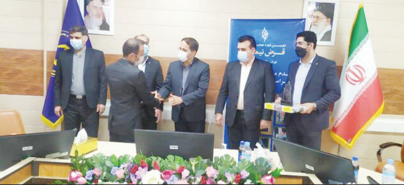
الحسنه مهر و رسالت نیز در سال جاری ۱۴ میلیارد و ۵۰۰ میلیون ریال قرض الحسنه به بیش از هزار و ۱۰۰ نفر پرداخت شده است. ماهی‌ری با بیان اینکه صندوق قرض الحسنه امداد

ولایت استان ایلام در سال ۹۵ فعالیت خود را آغاز کرده است، گفت: ترویج فرهنگ قرض الحسنه و نیکوکاری و مرتفع شدن مشکلات مالی و معیشتی نیازمندان از اهداف اولیه راه اندازی این صندوق قرض الحسنه بوده است. وی با اشاره به اینکه گسترده‌تر شدن خدمات قرض الحسنه‌ای این نهاد به نیازمندان و مددجویان و مشارکت بیشتر در برطرف شدن مشکلات آنها نیازمند سپرده گذاری مردم نیکوکار و نوع دوست است، تصریح کرد: از همه مردم نیکوکار استان برای سپرده گذاری در صندوق قرض الحسنه امداد ولایت دعوت می‌کنیم، مدیرکل امداد استان ایلام در پایان گفت: امسال بیش از ۲۸ میلیارد تومان تسهیلات قرض الحسنه به نیازمندان استان پرداخت شده است.